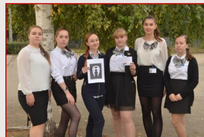
Збірна команда Оснів'янського району «Бізнес вумен»