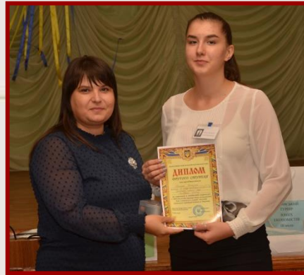
II місце ХГ № 12