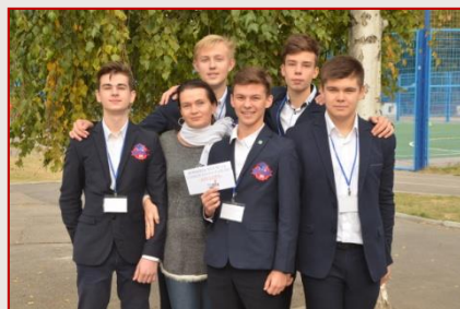
Команда ХТЛ № 173 Слобідського району «Квіддич»