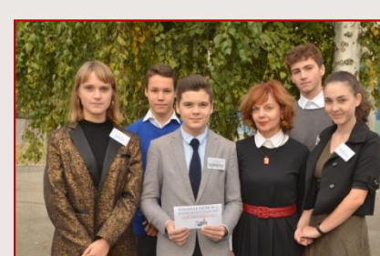
Команда ХЗОШ № 5 Київського району «5-й мегаполіс»