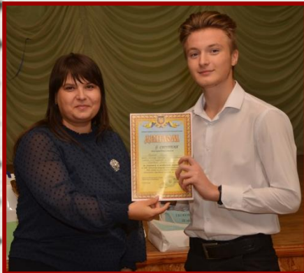
III місце ХСШ № 163