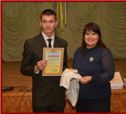
I місце ХГ № 55