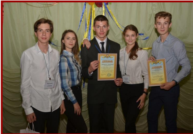
ЗБІРНА КОМАНДА КИЇВСЬКОГО РАЙОНУ «ПЕРСПЕКТИВА» (ЗЗСО №№ 55 та 164)