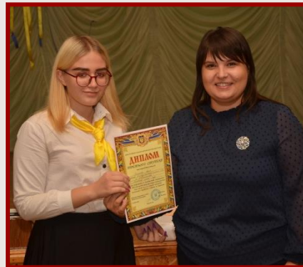
III місце ХГ № 46