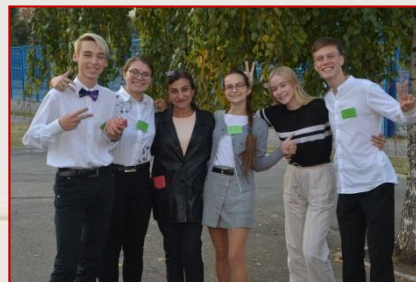
Збірна команда Московського району «Бізнес - сила»