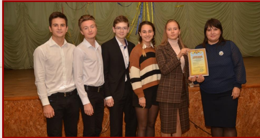
КОМАНДА ХСІІ № 162 НОВОБАВАРСЬКОГО РАЙОНУ "ELEKTRUM"