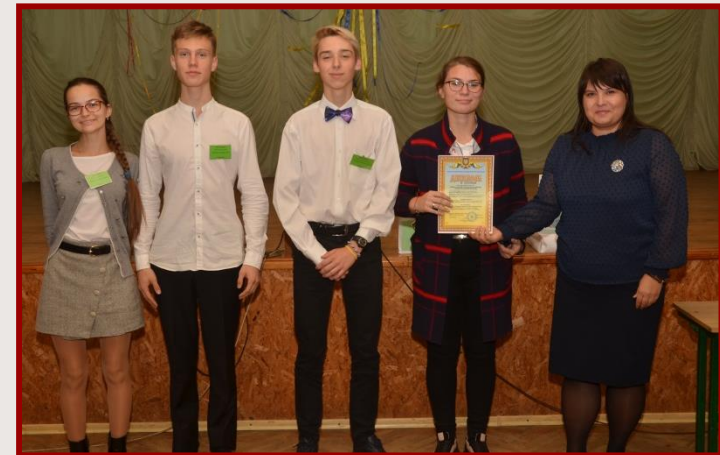
ЗБІРНА КОМАНДА МОСКОВСЬКОГО РАЙОНУ «НАЦІОНАЛЬНИЙ РЕЗЕРВ» (ЗЗСО №№ 43, 139, 156)