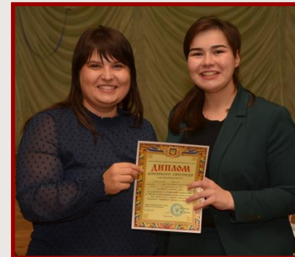
III місце ХНВК № 24