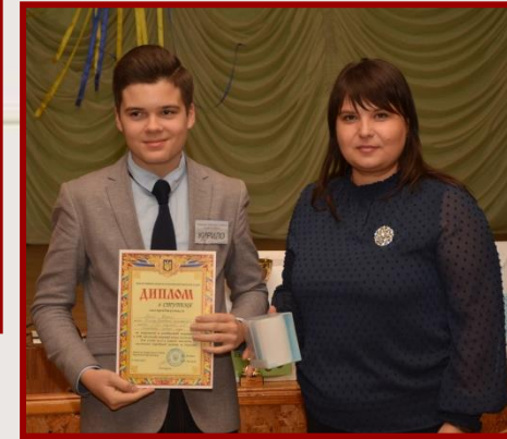
II місце ХЗОШ № 5