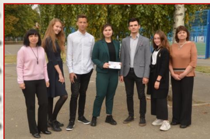
Збірна команда Немишлянського району «Креатив – За!»