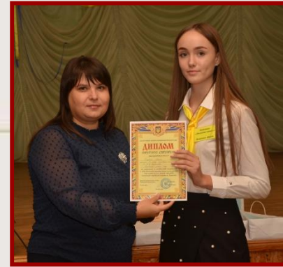
II місце ХГ № 46