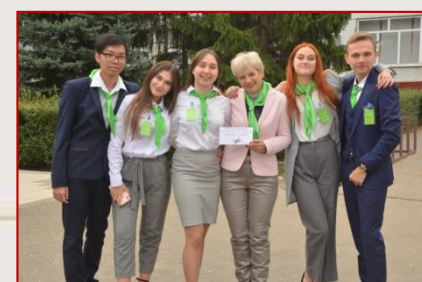
Збірна команда Московського району «Національний резерв»