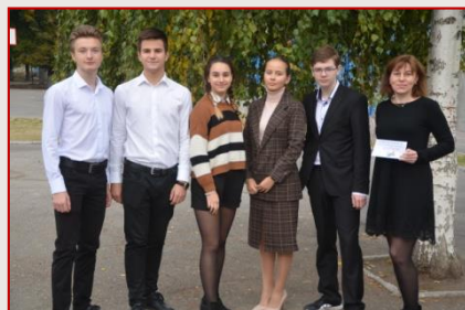
Команда ХСШ № 162 Новобаварського району «Elektrum»