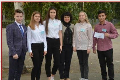
Збірна команда Індустріального району «Di vita»