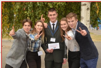
Збірна команда Київського району «Перспектива»