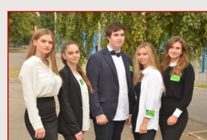
Збірна команда Шевченківського району «Оптіма»