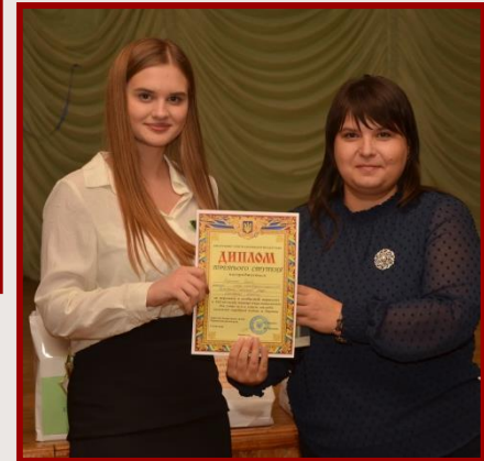
III місце ХЛ № 149