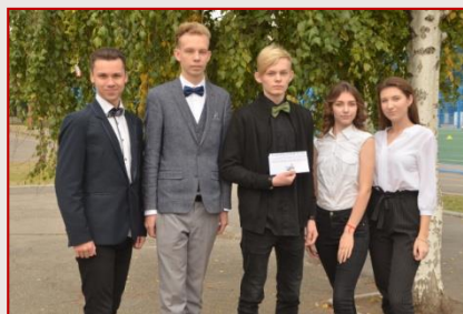
Команда ХЗОШ № 126 Холодногірського району «Креативні економісти»